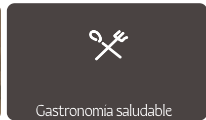
Gastronomía saludable y cocina de autor