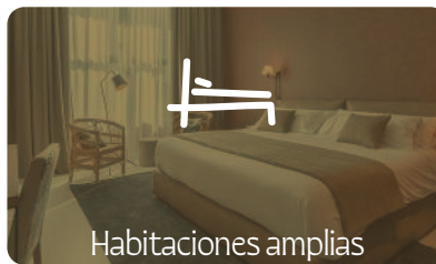
Habitaciones amplias y con todas las comodidades